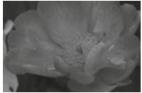
Da wohnt eine Kraft in mir Qigong Dancing