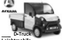
D-Truck Leichtmobile Tullastraße 6 79341 Kenzingen