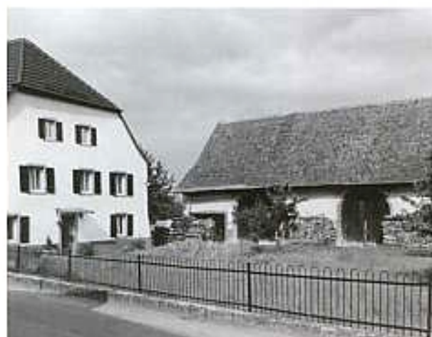
□ Gegenüber der Pfarrkirche steht dieses Parallelgehöft mit seiner stattlichen Scheune. Foto LDA 1993.

Schon von weitem sind Grunern und Wettelbrunn an ihren Pfarrkirchen zu erkennen, die mit ihren Kirchtürmen die Dörfer dominieren.