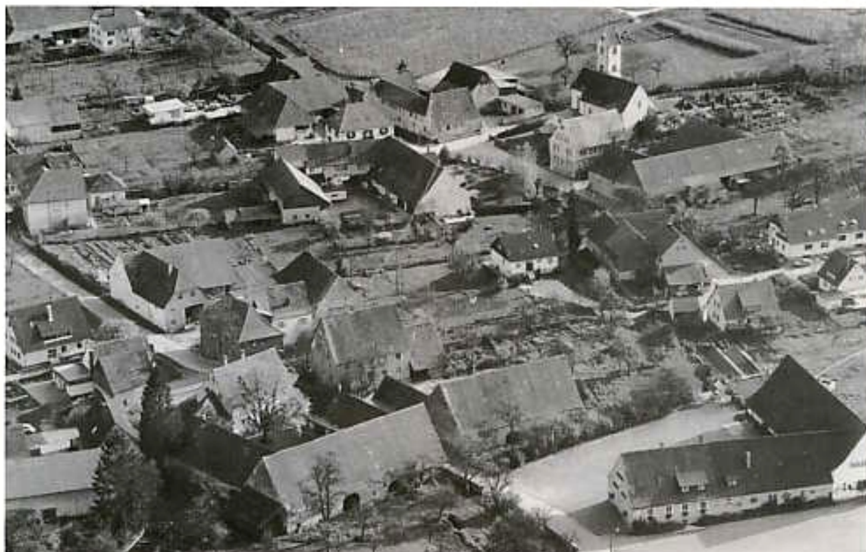
□ Große, meist vierseitige Hofanlagen bestimmen insbesondere die Bebauung im westlichen Teil von Wettelbrunn. Foto Kreisarchiv Bsg.-Hochschw. 1977.

tes Fertighaus gehört zu den frühesten Beispielen seiner Gattung. Sein eingeschossiger, kubischer Baukörper besteht aus einem Holzgerüst, das, als Isolierung, Torfplatten zwischen der Balkenkonstruktion besitzt. Aus den 50er Jahren schließlich stammt ein zu seiner Zeit viel beachtetes Notgebäude, das von der gleichen Firma gebaut wurde und von dem ein Prototyp auf