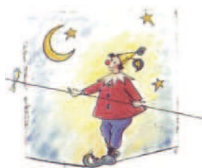
Kinder- und Jugendzirkus Faustino Staufen