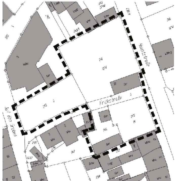
Abgrenzung Geltungsbereich Veränderungssperre (ohne Maßstab)

Für den Geltungsbereich der 2. Verlängerung der Veränderungssperre ist somit der folgende Lageplan maßgebend: