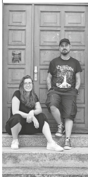
Team der Jugendarbeit Staufen

Neben den genannten Angeboten sind wir auch „mobil“ in Staufen unterwegs und ansprechbar für eure Anliegen. Weitere Angebote und Projekte sind in Planung. Änderungen sind möglich. Infos darüber gibt's auch auf Instagram oder Facebook unter jugendarbeit.staufen.