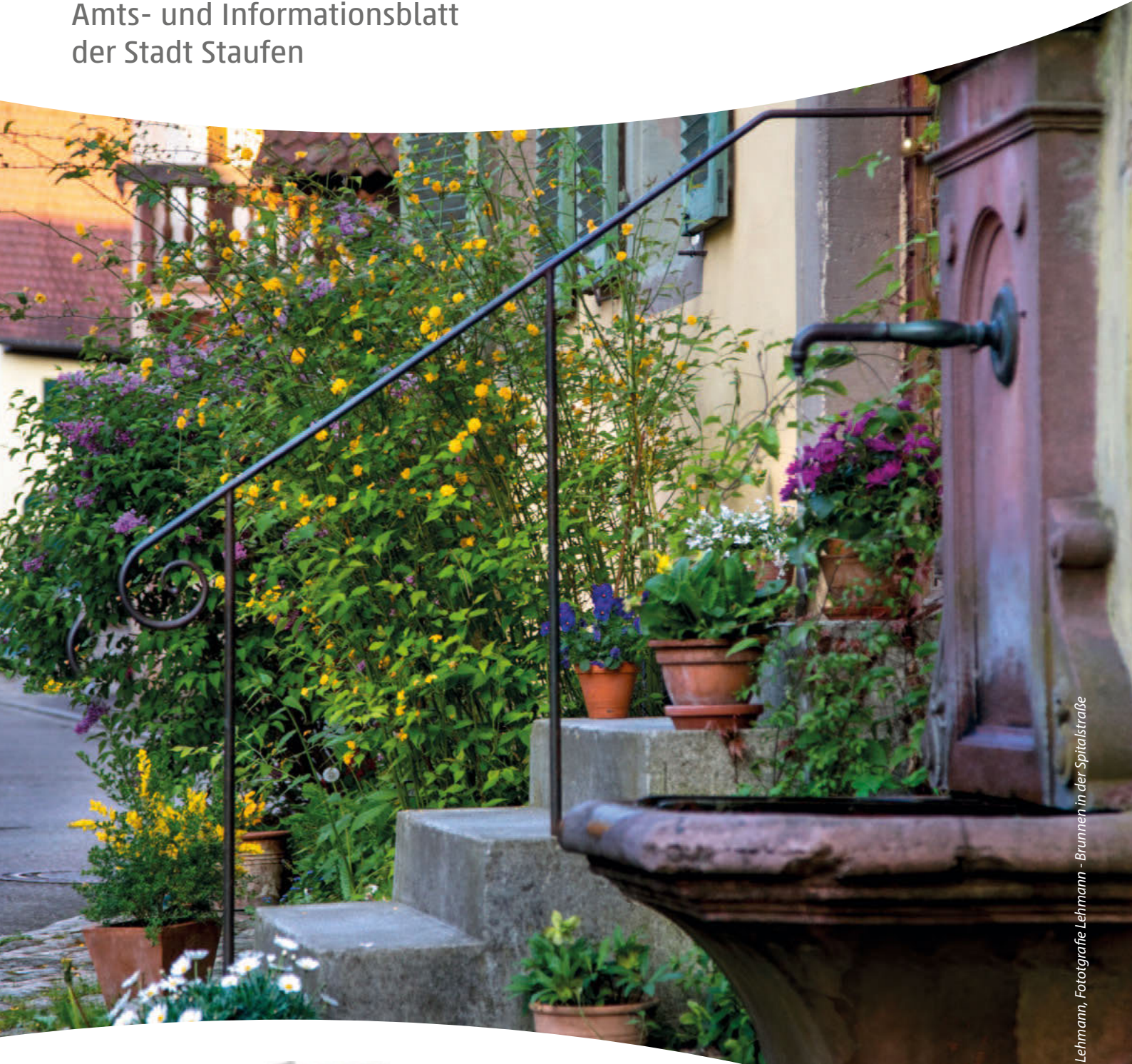
Brunnen in der Spitalstraße

Amts- und Informationsblatt der Stadt Staufen