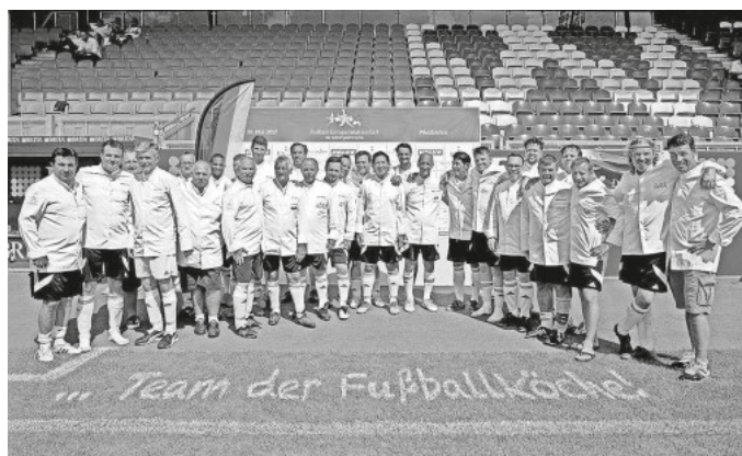
Tauschen Töpfe gegen Tore: Die Fußballköche kicken am 17. Juni für den Bundesverband Kinderhospiz!

Deshalb treten die Fußballköche bei ihrem nächsten Charity-Fußballturnier für den Bundesverband Kinderhospiz an. Anpfiff ist am Montag, 17.06.2019, um 15 Uhr auf dem Sportgelände des VfR Hausen. Mit dabei sind die Deutsche Fußballmannschaft der Spitzenköche und Restaurateure e. V., die Deutsche Weinfußball e. V. und die Schweizer Fußballköche. Um 19 Uhr beginnt dann in der Eventhalle des Fallerhofs die „Dritte Halbzeit“ mit Live-Band, Tombola und Show-Tanzgruppe – und selbstverständlich ist für das leibliche Wohl gesorgt! Eintrittskarten für die besondere Abendveranstaltung zugunsten des Bundesverband Kinderhospiz erhalten Sie unter info@fallerhof.de .