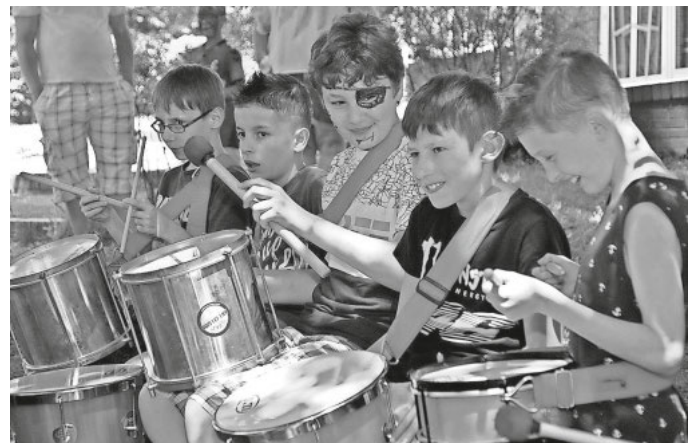
Text und Foto: Dr. Friederike Zimmermann

Eines der Highlights war sicherlich der Auftritt der Trommelgruppen, die die Lilienhofschule in Kooperation mit der Jugendmusikschule Südlicher Breisgau im Rahmen des Bundesförderprogramms „Kultur macht stark!“ unter der Leitung Shakir Ertek durchführt. Das ganze Jahr über haben sie fleißig geübt, und so dauerte es nicht lange, dass sich das Publikum von den ansteckenden Rhythmen, Liedern und Stücken mitreißen ließ. Anlässlich des heißen Wetters hatte die Gruppe für heute auch Sambarhythmen vorbereitet, da fühlte man sich doch gleich wie in Brasilien! Noch viel mehr, da im Anschluss die größeren Schüler mit richtigen Samba-Instrumenten loslegten. Am Schluss traten nochmal alle Kinder zusammen auf – das war für die Kinder sogar eine „absolute Premiere“, wie Shakir Ertek verriet, denn zusammen waren sie bisher noch nie aufgetreten. Dass das trotzdem so gut klappte, verdankt sich nicht zuletzt dem großen Spaß, den die Kinder offensichtlich bei diesem Projekt haben.