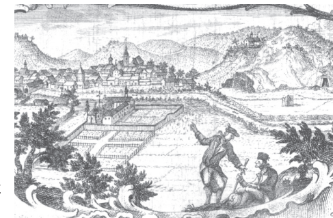
Ansicht der Stadt Staufen, rechts Grubenbau am Höllenberg (Kupferstich aus dem 18.Jh.)