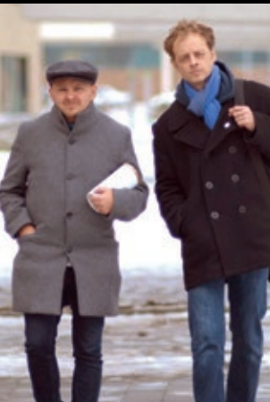
DUO BLÖZINGER Wien

Montag 9.10.2017 · 20.00 Uhr · Spiegelzelt