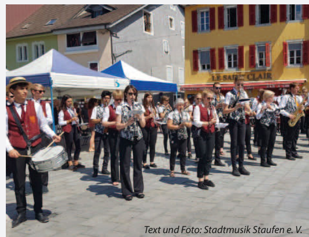
Text und Foto: Stadtmusik Staufen e. V.

Der Annafestausschuss der beiden Kirchengemeinden weist darauf hin, dass am Sonntag, den 25.07.2021, um 9:00 Uhr Böllerschüsse auf dem Schlossberg abgefeuert werden.