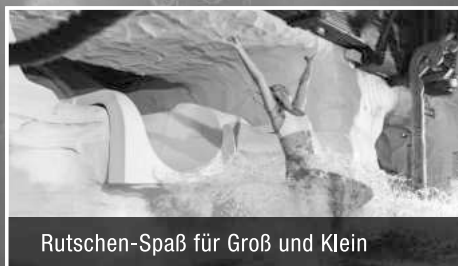
Rutschen-Spaß für Groß und Klein