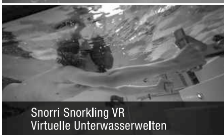
Snorri Snorkling VR Virtuelle Unterwasserwelten