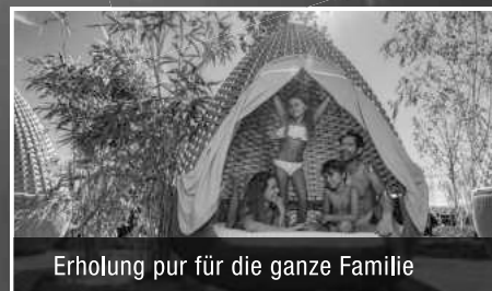
Erholung pur für die ganze Familie