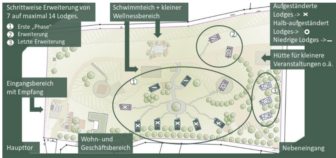
Lageplan Konzept (Vinea Lodges, Mai 2023)

Der landwirtschaftliche Schuppen im Zentrum des Plangebiets soll in einen Wellnessbereich umgebaut werden und durch einen naturnahen Schwimmteich bzw. Naturpool ergänzt werden. Das nahegelegene kleinere Wirtschaftsgebäude soll ebenfalls erhalten und dem Betrieb der Freizeitanlage dienen.