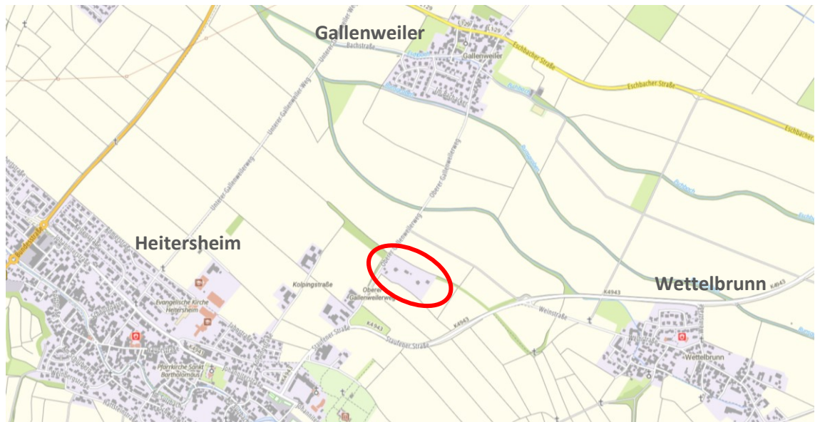
Lage im Raum (Geoportal-BW, Juli 2023)