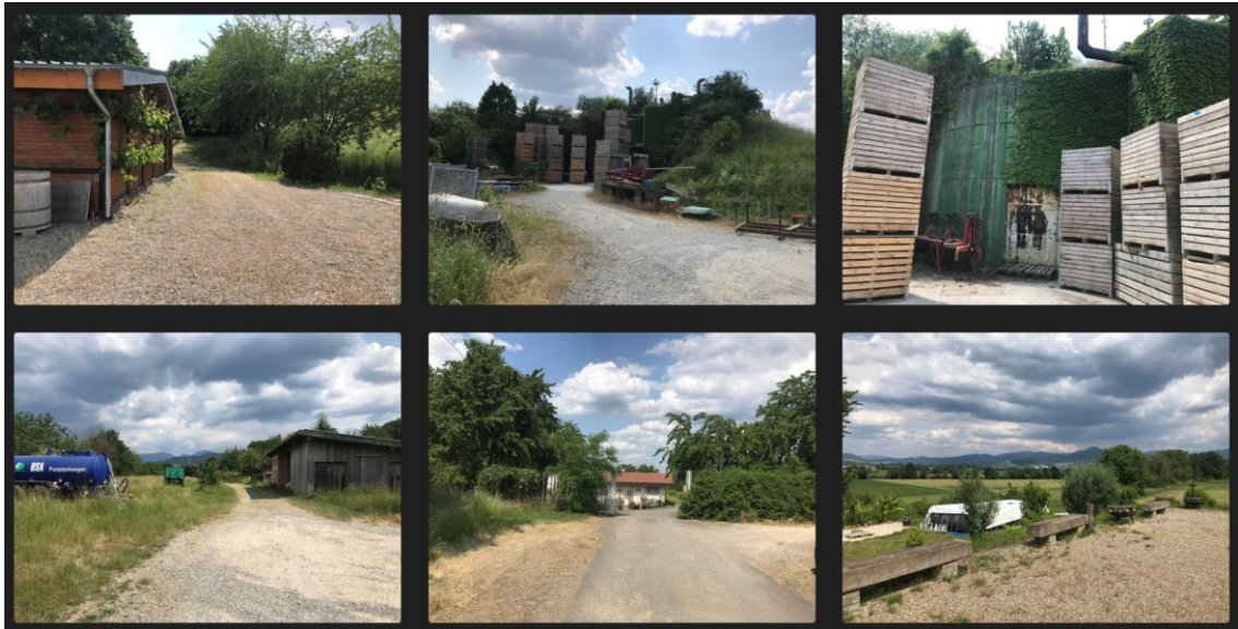
Bestand (Juni 2023)

Die Bestandsgebäude sind eingeschossig, die Tanks sind größtenteils überdeckt und ragen bis zu 8 m über das nördlich angrenzende Gelände als Hügel oder Zufahrtbereich hinaus.