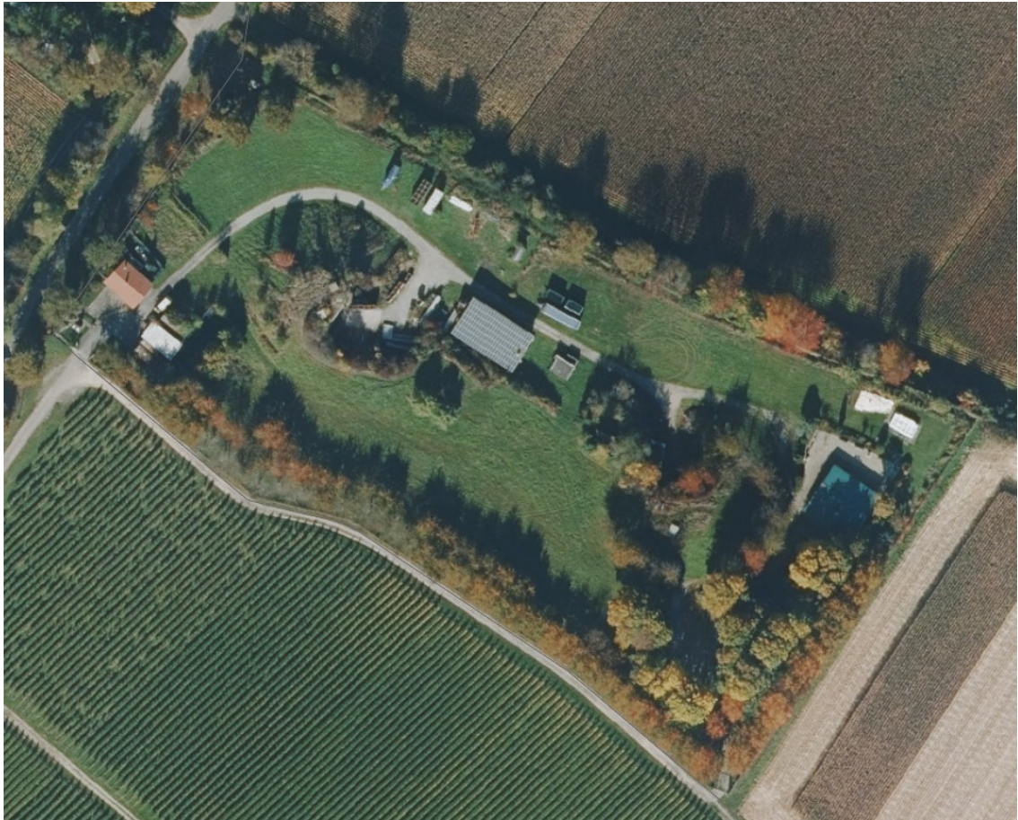
Luftbild (Geoportal Raumordnung, 2022)