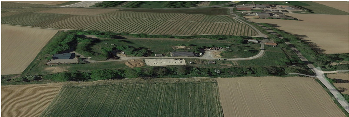
Schrägbild Google Earth 2020 von Norden

Topografisch steigt das Gelände von Nordwesten nach Südosten um etwa 9 m an. Zusätzlich befindet sich zum südwestlich angrenzenden landwirtschaftlichen Weg eine Böschung mit Biotop, welches frei jeglicher Nutzung ist und bleibt. Im Zusammenspiel mit den überdeckten Tanklagern ergibt sich somit ein stark reliefiertes, wenig einsehbares Plangebiet.