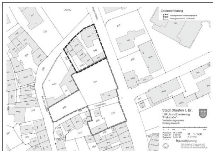
Abgrenzung Geltungsbereich (ohne Maßstab)

Für den Geltungsbereich des Bebauungsplans mit örtlichen Bauvorschriften „Frickstraße, 1. Änderung“ ist der nachfolgende Übersichtsplan vom 18.12.2024 maßgebend. Das Plangebiet umfasst die Grundstücke Flst.-Nrn. 240, 240/1 und 241 (Teil), jeweils Gemarkung Staufen.