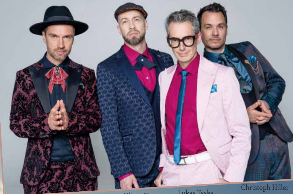
Jan Bürger Countertenor

Freitag, 10. 10. 2025 20 Uhr, Spiegelzelt